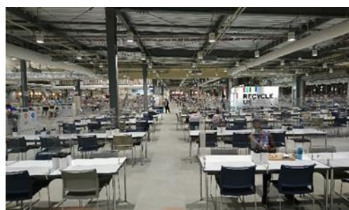
② メインダイニング