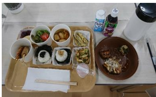
③ カジュアルダイニング (日本食を提供)