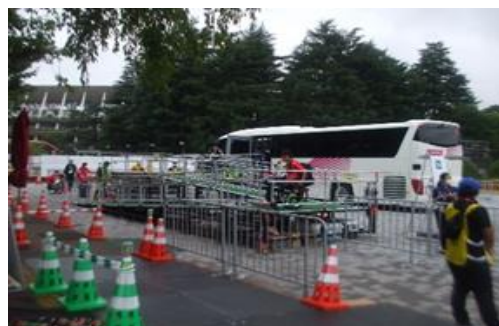
④ トランスポートモール (競技会場の昇降場)

今回のパラリンピックは、オリンピックに続き新型コロナウイルス感染拡大が懸念される中での開催となりましたが、162 の国や地域選手団及び難民選手団約 4400 人が参加し過去 2 番目に多い参加状況でした。この大会は最高峰の国際大会で、22 競技 539 種目が行われました。